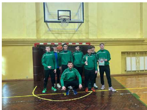
Tabela końcowa mistrzostw: